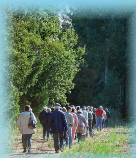
Les propriétaires ont participé à des visites de sites le matin...

On arrivera certainement à cette rémunération, mais quand ? Probablement quand le changement climatique posera des problèmes considérables..."