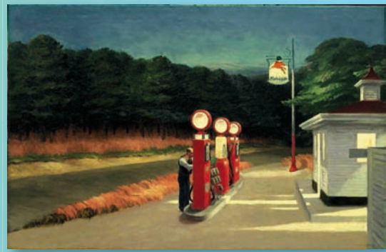
Rephotographie Tableau Edward Hopper

Le guide classe en particulier les différentes essences en fonction de leur sensibilité au climat (voir encadré), ce qui permet d'affiner les choix par grands types de milieux.