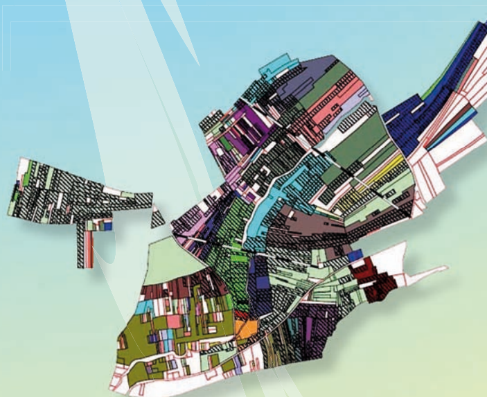
Ancerville : chaque couleur représente un propriétaire forestier, les parcelles achetées ou échangées sont figurées par des rayures.

Pour tous renseignements : Marie-Françoise Grillot au 03 83 90 10 70