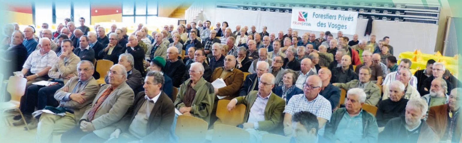
Une assemblée nombreuse lors de l'AG de fusion de Groupe For'Est et du Syndicat le 11 juin 2016 à Xertigny

Dans un contexte de fusion des anciennes régions en grands ensembles et dans un environnement où la communication devient un outil essentiel pour se faire entendre, il est devenu indispensable de "peser" pour exister. Pour autant, les forestiers savent que dans nos métiers, la proximité est un facteur essentiel de réussite. Dès lors, comment se regrouper pour être plus fort tout en restant proches des sylviculteurs de terrain : c'est le défi relevé par les forestiers privés vosgiens !