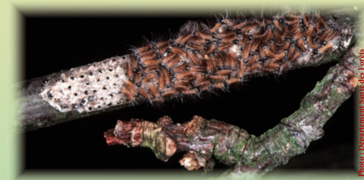
Pontes et chenilles processionnaires du chêne