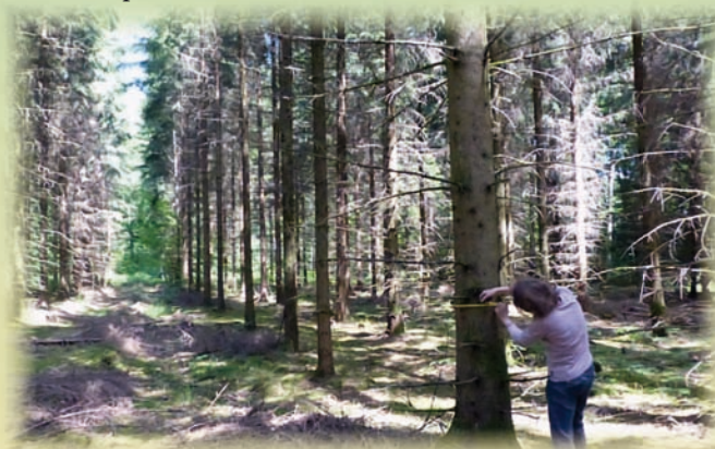
Peuplement d'épicéa après éclaircie

Pour renforcer l'efficacité du système, les chantiers sont regroupés et permettent aux propriétaires de bénéficier de meilleurs prix.