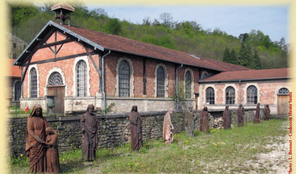
Ecurey (commune de Monthiers/Saulx) : La dernière fonderie de Meuse ayant consommé du bois