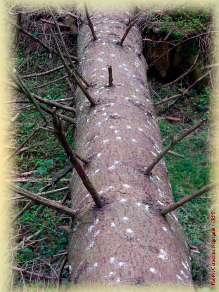
Piqûre sur grume d'épicéa, résultat du travail du scolyte liseré