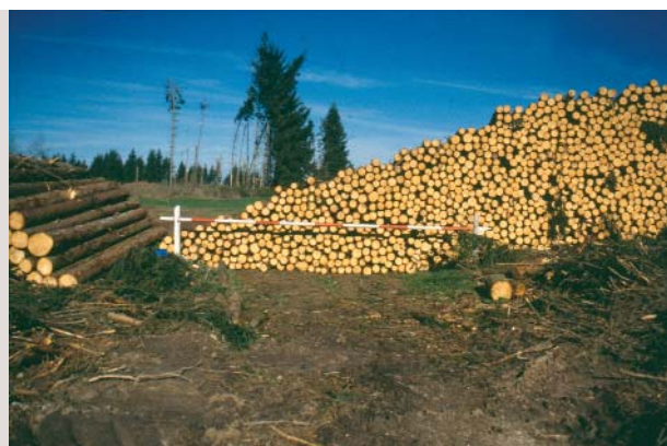
Du bois de trituration ? Oui, mais en grande quantité