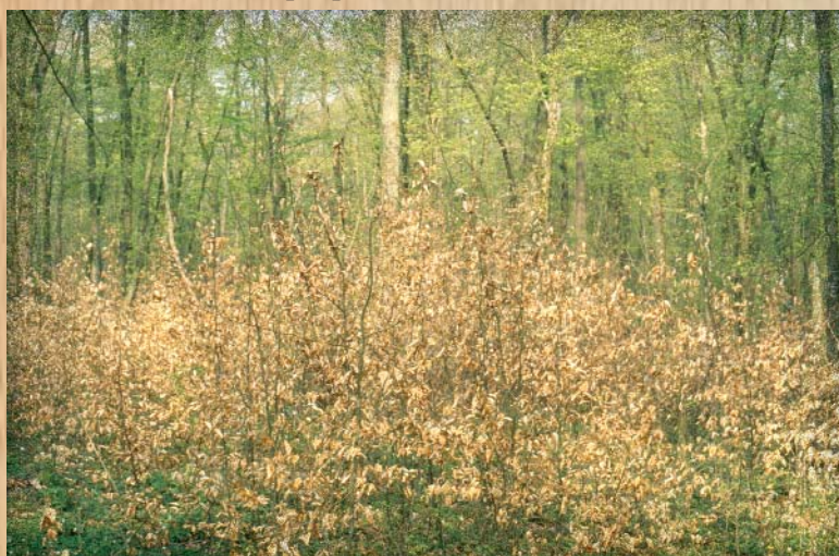
Exonération d'impôt foncier sur la régénération naturelle...

La grande nouveauté : la régénération naturelle n'est plus la "mal aimée" de l'Administration fiscale. L'exonération s'applique sous les conditions suivantes : présence de semis d'essences forestières "classiques", également réparties sur au moins 70 % de la surface, une densité minimale de 1100 semis/ha pour le Frêne, le Merisier ou l'Érable Sycomore, ou 2000 semis/ha pour les autres essences. La hauteur des semis doit être comprise en 1,5m et 3m. Concernant la durée, il faut là encore distinguer le cas des résineux (30 ans), de celui des feuillus (50 ans). Le peuplier est exclu.