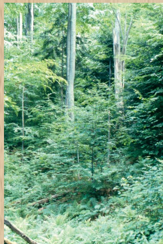
... et la futaie irrégulière

classiques, avec une hauteur comprise entre 3 et 10 m et réparties sur au moins le ¼ de la parcelle. Le peuplement proprement dit doit avoir une structure de futaie irrégulière, c'est-à-dire présenter sur l'ensemble de la surface une diversité dans les diamètres ou dans les âges. L'impôt foncier est alors réduit de 25 % pendant une durée de 15 ans renouvelable.