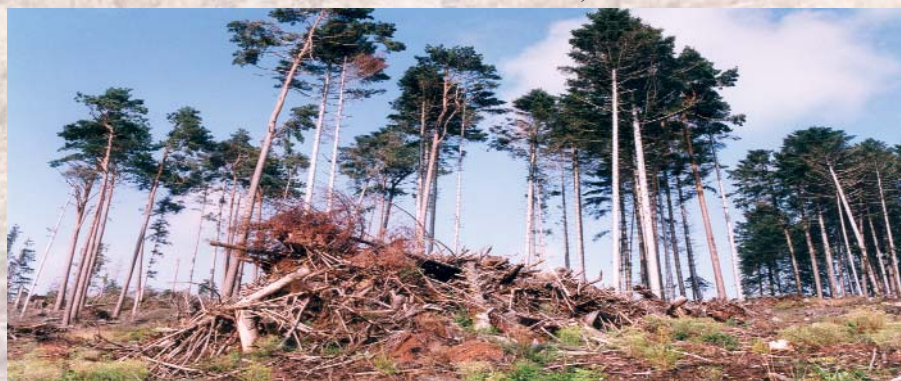
Les andains, une des techniques de nettoyage présentée