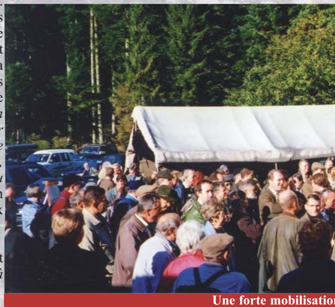
Une forte mobilisation

Les échanges se poursuivent sur les risques de prolifération de ravageurs dans les andains (hylobe, rongeurs,