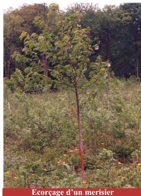
Ecorçage d'un merisier

Même si les méthodes sylvicoles ( gainage des plants, maintien de gagnages dans les cloisonnements ) et les "protections" permettent d'atténuer ces inconvénients, elles coûtent cher et ne sont pas une garantie absolue. Aussi est-il indispensable d'intervenir énergiquement pour faire augmenter et réaliser les plans de chasse. Cette mesure devient urgente, au moment où