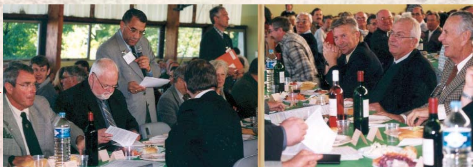
La parole a été donnée aux personnalités sur les problèmes de la forêt privée

Faut-il rappeler que l'on se trouve proche du Donon, secteur réputé pour ses populations abondantes de cerfs et chevreuils.