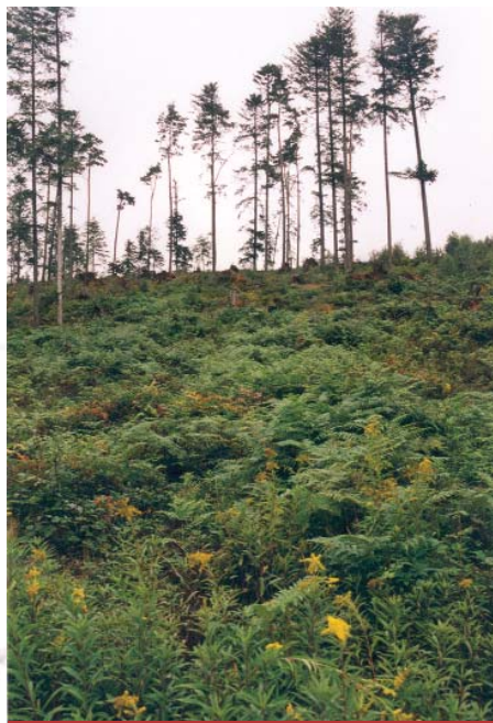
Une végétation plutôt envahissante !

Autre arrêt, autre débat. Celui de la régénération naturelle dans la forêt de Talhouët. Des zones aux semis denses côtoient des surfaces où les jeunes pousses s'installent avec difficulté. Le propriétaire a fait le choix d'une reconstitution naturelle, mais n'exclut pas les compléments par plantation, là où les semis feront défaut.