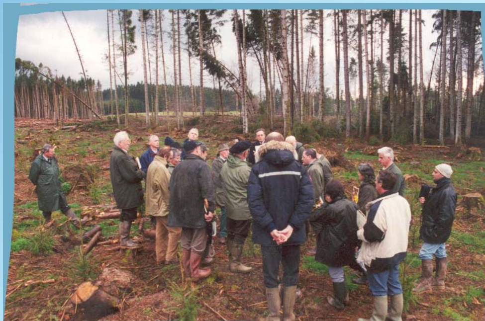
Le Conseil d'administration sur le terrain, au lendemain de la tempête

En revanche, vous pouvez voter plusieurs fois si vous représentez plusieurs indivisions, ou personnes morales.