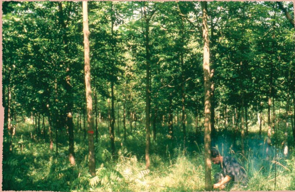
Dépressage réalisé dans une plantation de Noyer noir

En régénération naturelle, comme en plantation traditionnelle, la nature nous gâte et il y a vite trop de tiges. Dès que les arbres atteignent 8 à 13 mètres de haut pour un diamètre de tige inférieur à 10 cm (stade de gaulis / bas-perchis) ils n'arrêtent plus de se gêner. Ils se concurrencent pour un oui, pour un non, la lumière, les éléments nutritifs du sol, l'eau. Cette situation sera la grande responsable de cimes étriquées, de systèmes racinaires boîteux, et d'arbres fragilisés. Il est alors urgent de se découvrir interventionniste et de dépresser (normalement avant 15 ans).