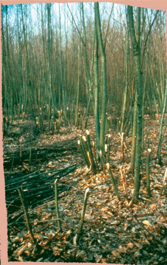
Dépressage de tiges désignées

Je veux trouver dans la régénération naturelle les plants manquants. Je ne veux pas de trouées. Je connais bien les coins riches en semis et les autres où il faut les chercher "