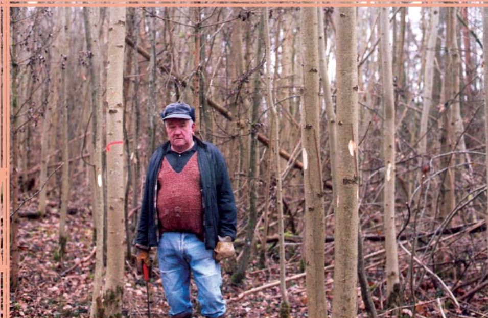
Dépressage dans du frêne à Wolfskirchen (Bas-Rhin)